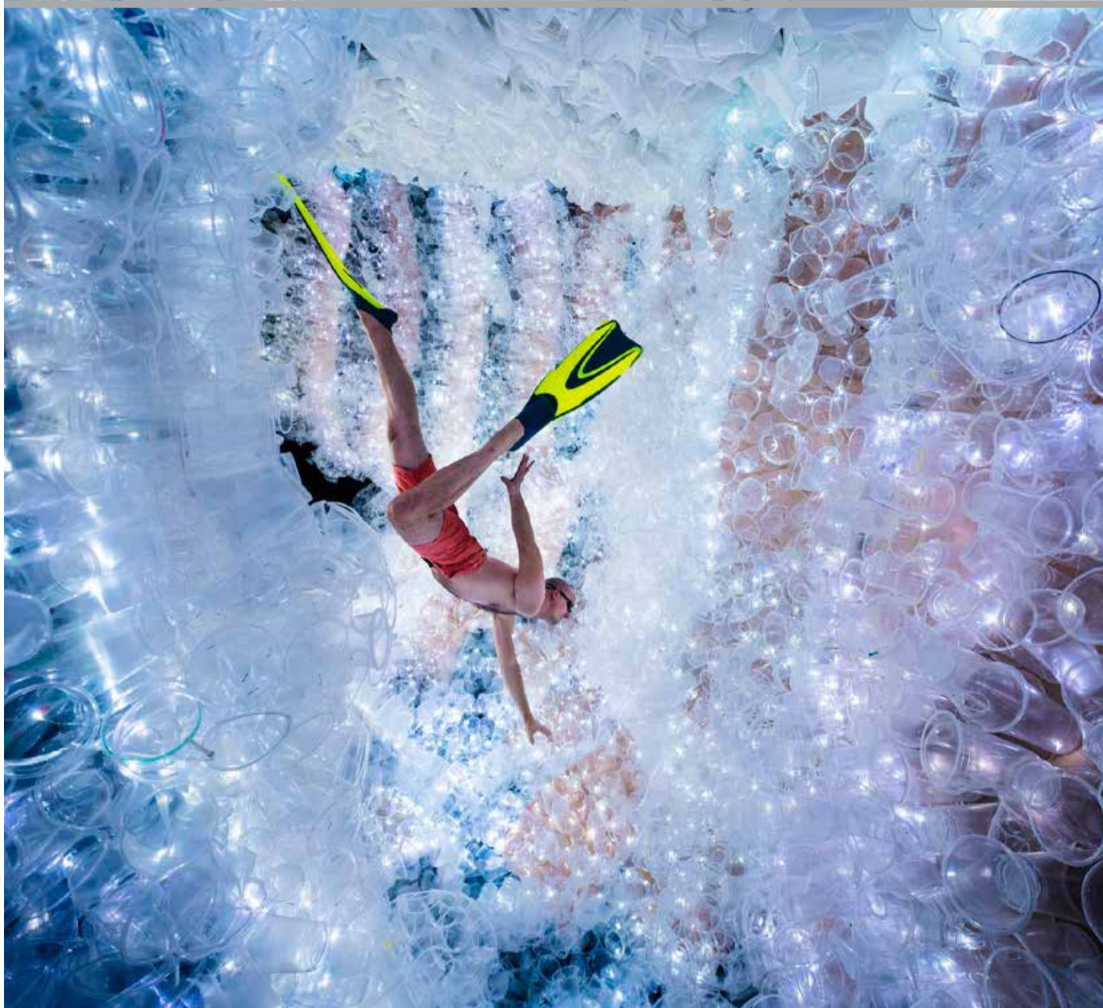
De installatie 'Plastikophobia' van de Canadese kunstenaar Benjamin Von Wong is gemaakt van achttienduizend plastic bekertjes.