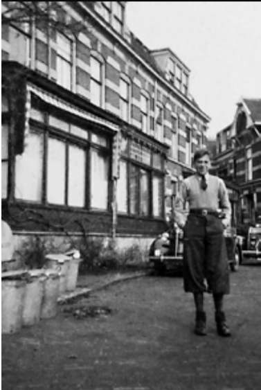
De jonge Ramses tijdens de Tweede Wereldoorlog.