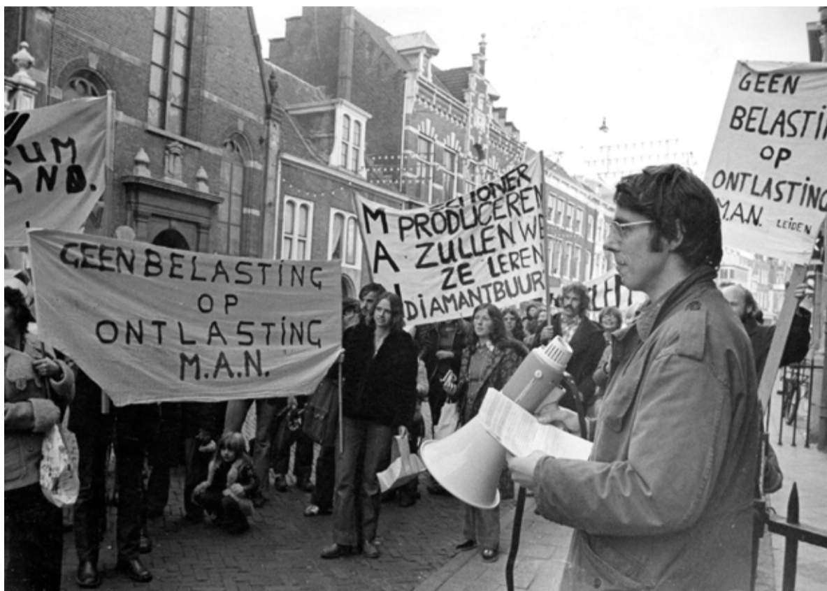
Actie voeren was belangrijk voor de partij, zowel landelijk als lokaal. Foto's uit besproken boek

Actie voeren was en is belangrijk voor de partij. 'Het ging van heel kleine zaken naar heel grote kwesties. Er werd actie gevoerd voor een