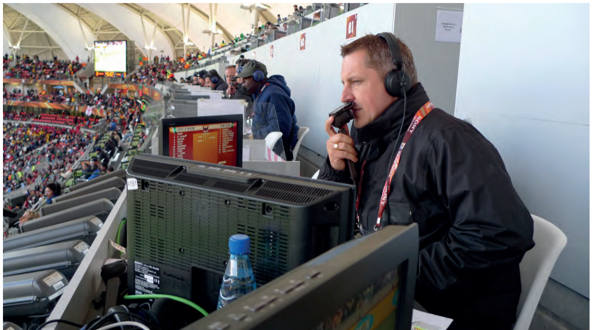
"Literally: a term used, particularly by sports commentators, to denote an event that is not literally true."

As it turns out, the results differ from what you might find in grammar guides. According to the Oxford English Dictionary, there's absolutely nothing wrong at all with a split infinitive. "To go boldly" is not better than "To boldly go", they