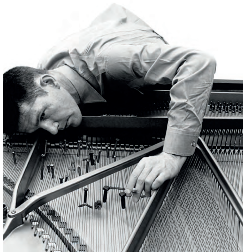
John Cage, componist van het stuk Living Room Music .