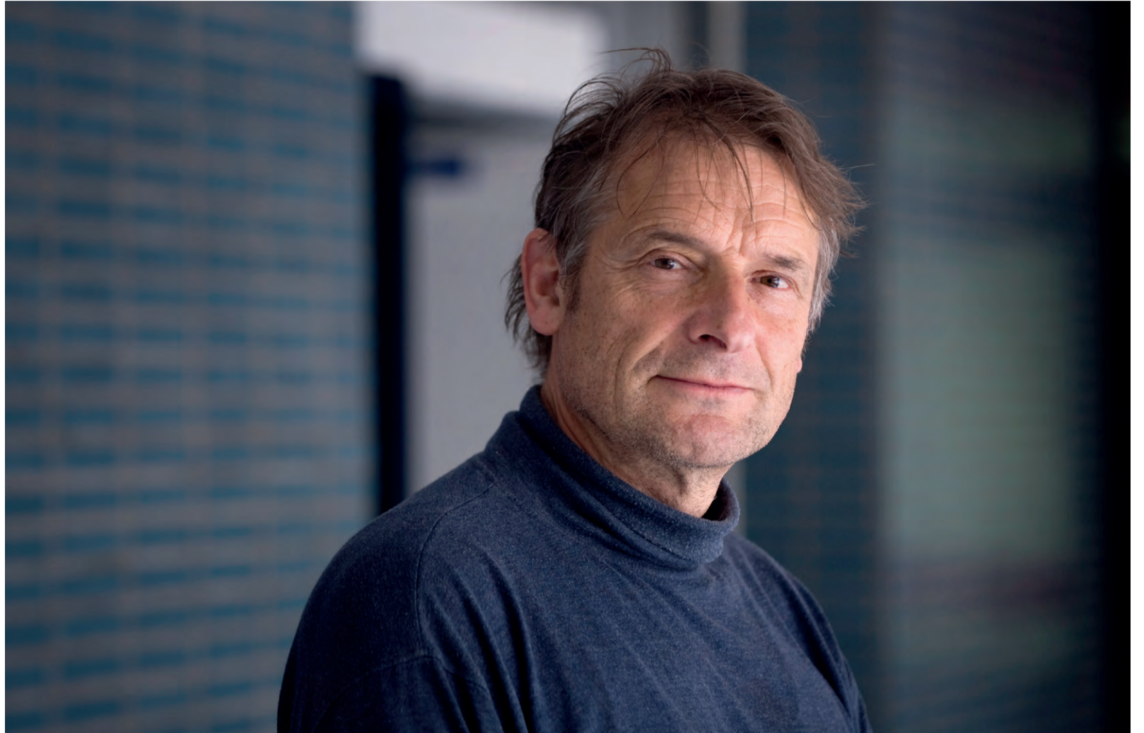
'Wat me aangreep in de zaak Lucia de Berk, is dat wij met zijn allen echt opgelicht werden.'