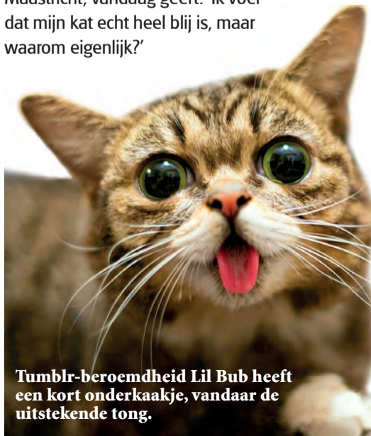
Tumblr-beroemdheid Lil Bub heeft een kort onderkaakje, vandaar de uitstekende tong.