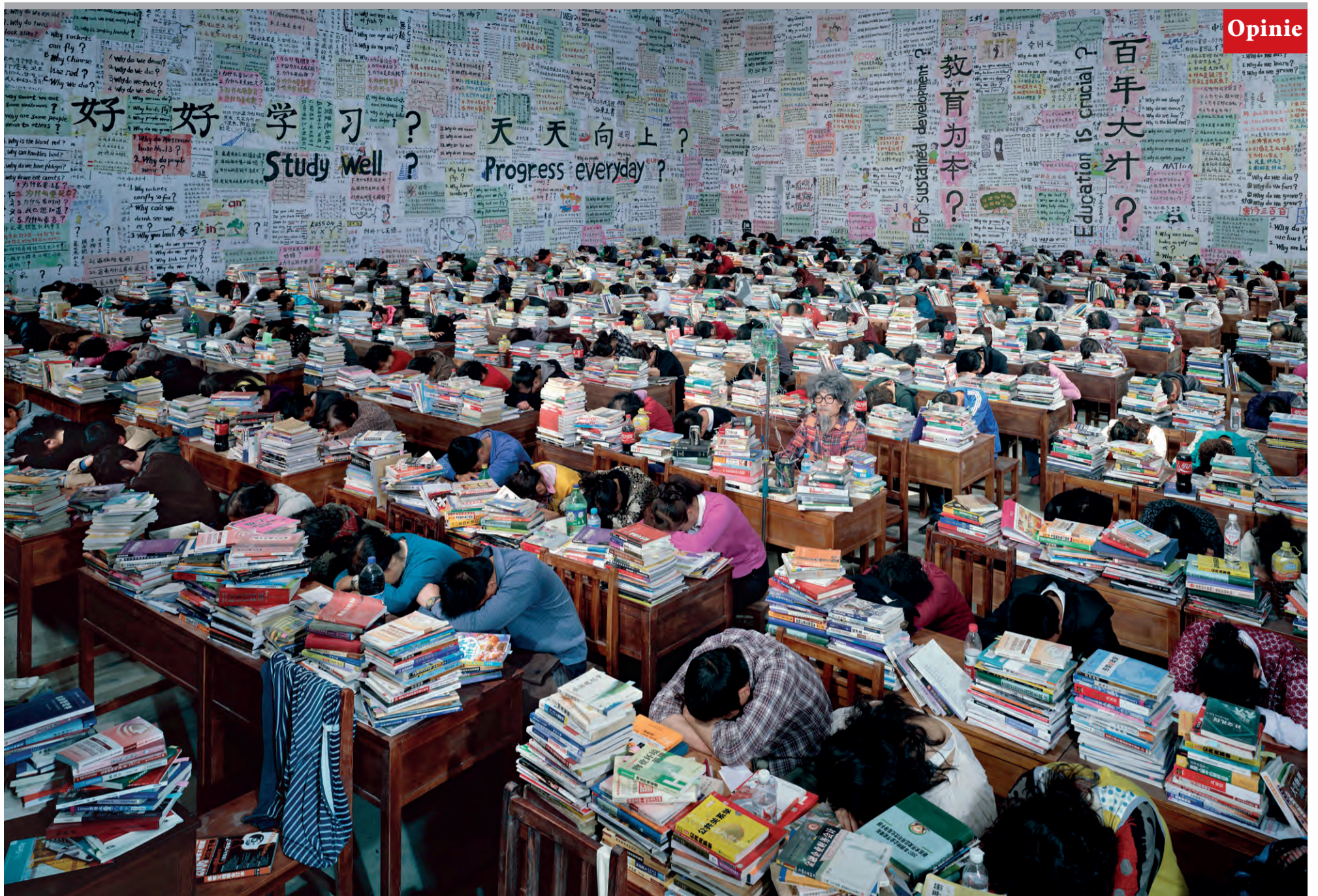
Follow You (2013), van de Chinese kunstenaar Wang Qingsong, die in zijn werk de razendsnelle modernisering van zijn land becommentarieert.