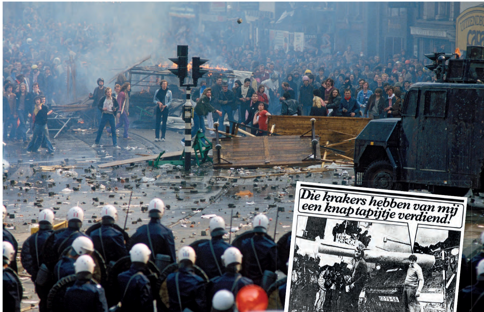
Rellen tijdens de kroning van koningin Beatrix, 30 april 1980.

In tegenstelling tot hun Amsterdamse collega's waren krakers in Leiden behoorlijk beleefd. Tijdens de Nacht van Kunst en Kennis geven historici een rondleiding.