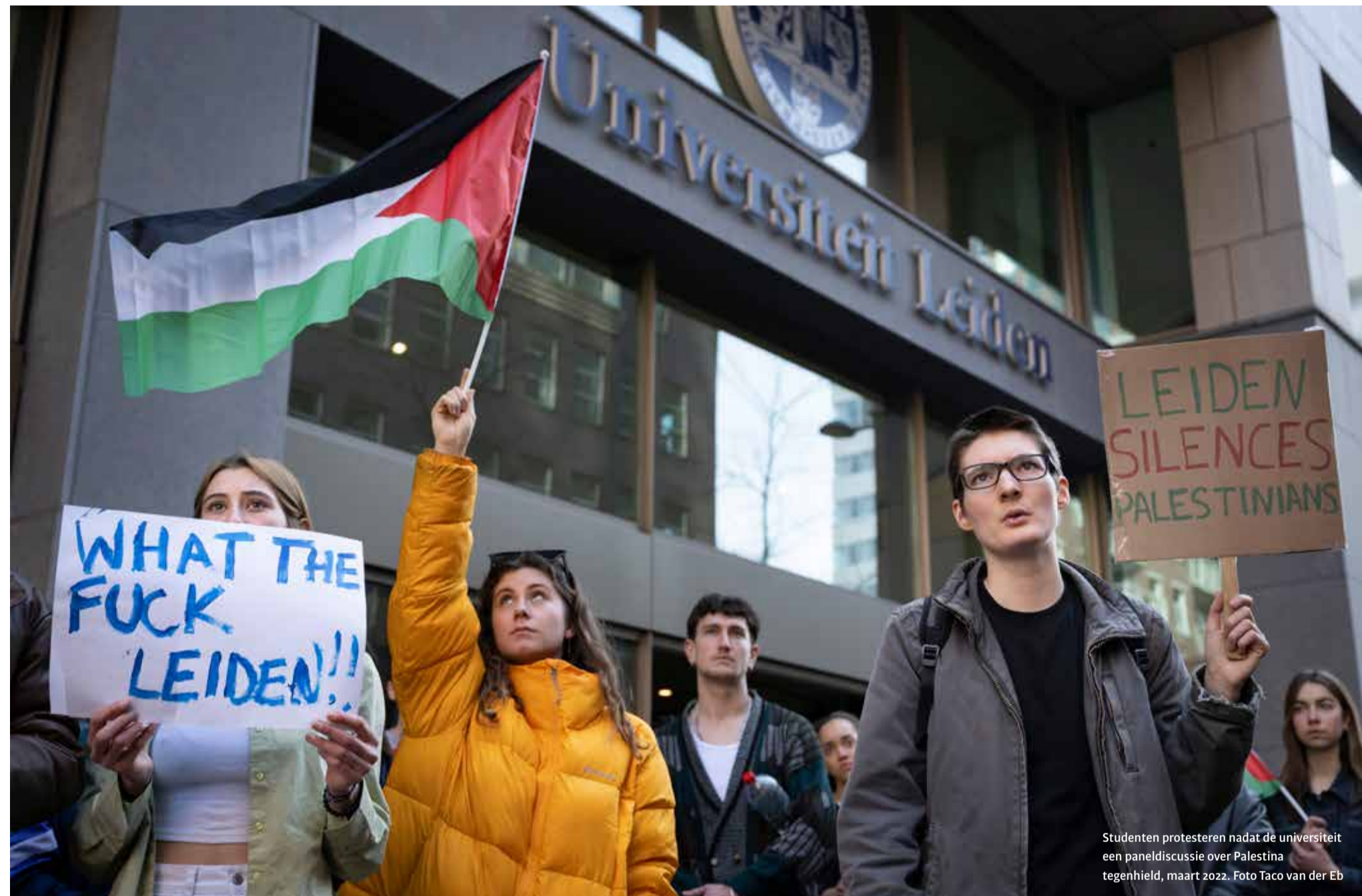
Studenten protesteren nadat de universiteit een paneldiscussie over Palestina toegestaan heeft, maart 2022.

‘Opkomen voor de rechten van Palestijnen hoort bij een gezonde academische gemeenschap’