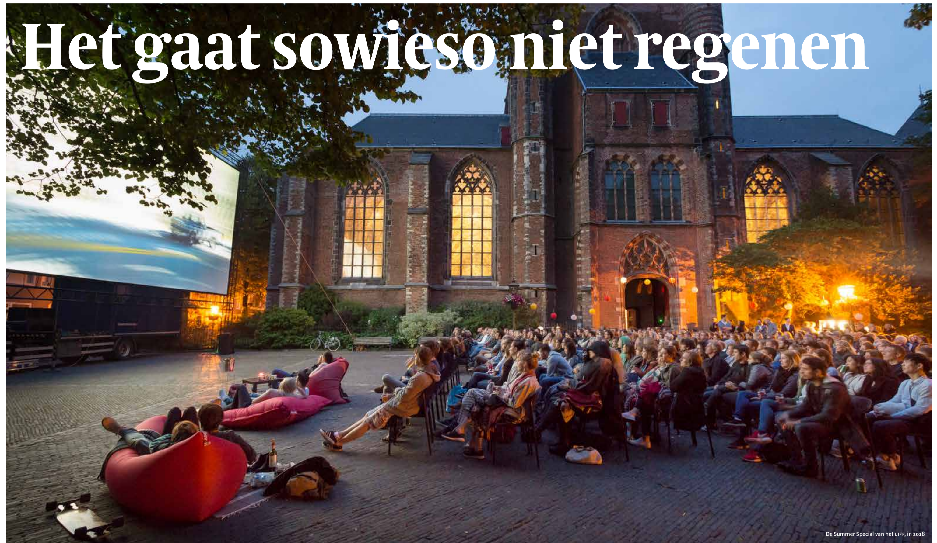
De Summer Special van het LIFF, in 2018