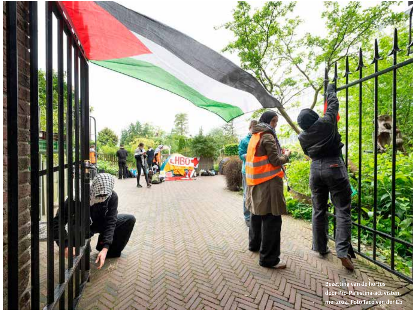
Bezetting van de hortus door Pro-Palestina-activisten mei 2024.

Als er aan de Leidse universiteit angst heerst onder Joodse studenten en stafleden wordt die veroorzaakt door kritiek op Israël, niet door fysieke incidenten, schrijft Joost Augusteijn .