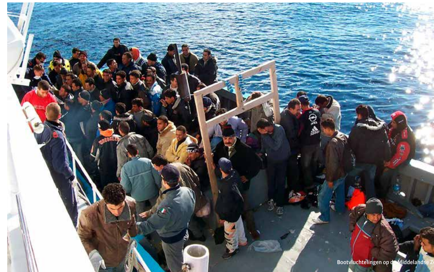
Bootvluchtelingen op de Middellandse Zee