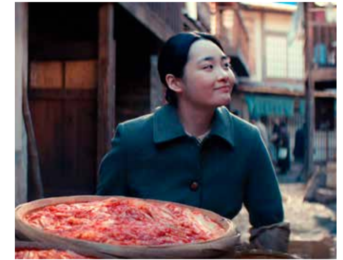
Stills uit Pachinko. Links: Hoofdpersoonage Sunja met haar echtgenoot en kind. Boven: Sunja verkoopt kimchi op de markt in Osaka.