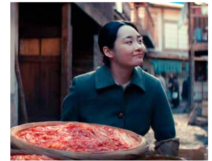
Stills uit Pachinko. Links: Hoofdpersoonage Sunja met haar echtgenoot en kind. Boven: Sunja verkoopt kimchi op de markt in Osaka.