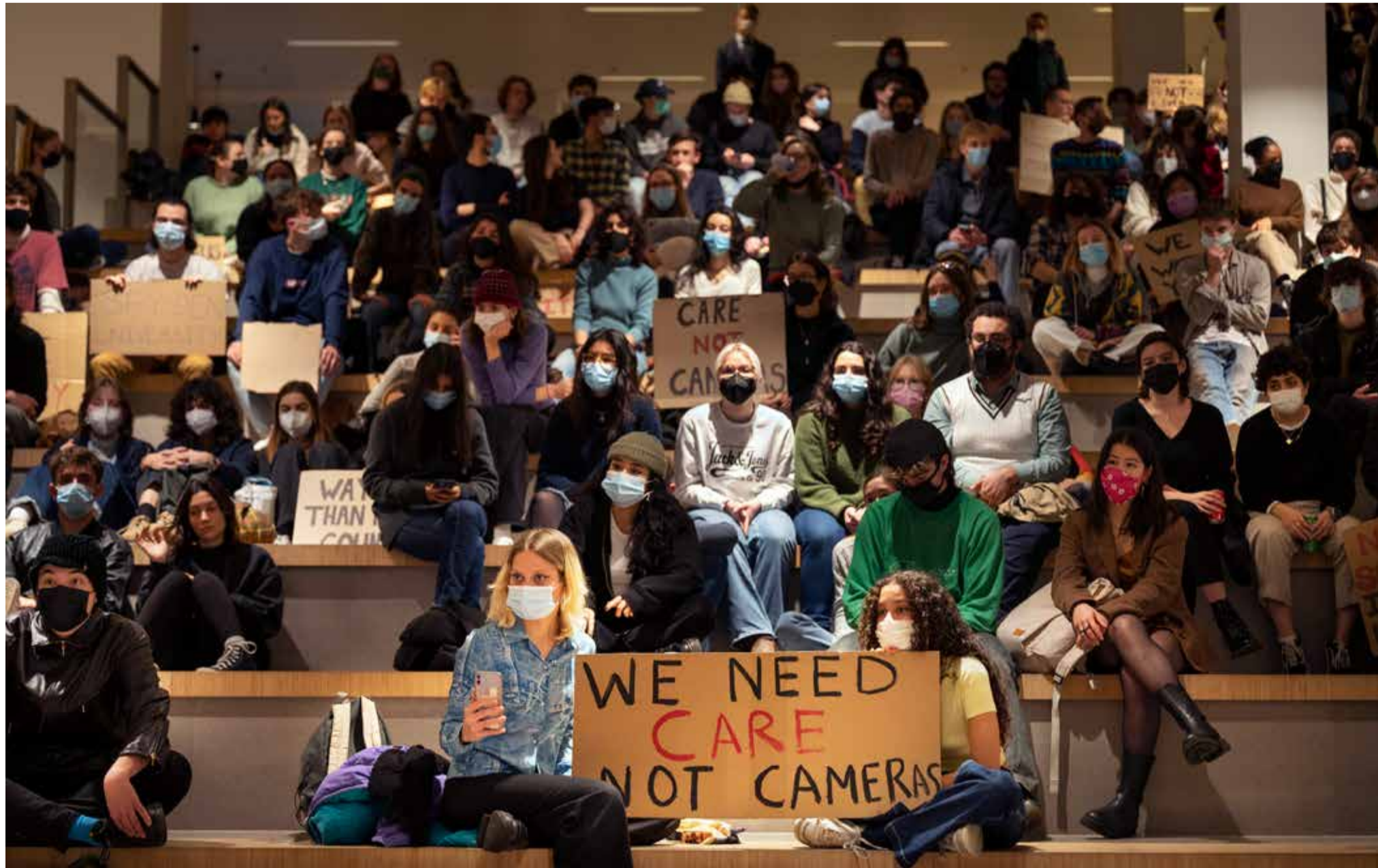
Protest tegen de slimme camera's in Wijnhaven, Den Haag, december 2021

lijkheden tot uitzonderingen. We lopen dus het risico dat we enorme schade toebrengen.’ De Zeeuw wil dat het college de mogelijkheid biedt om niet onder de regeling te hoeven vallen. ‘Deze studies moeten daar dan wel zwaarwegende redenen voor aanvoeren.’ ‘Dit is een heel valide punt’, stelde Rebekka van Beek van studentenpartij PBMS. ‘Ook bij Geneeskunde is dit een probleem.’ Alleen vraag ik me af of dit niet al benoemd is in de richtlijn. Daar staat dat in “enkele gevallen vijftien punten vrije keuzeruimte mag worden geroosterd. Dit is het geval wanneer beroepsseisen, bijvoorbeeld geneeskunde of notarieel recht, zorgen voor beperkte ruimte in het curriculum.” De Zeeuw vond die bepaling nog niet ruim genoeg. ‘Dat neemt niet weg dat het nog steeds om een blok in een semester gaat en dat is nog steeds schadelijk, met name voor taalverwerving. Mijn voorstel zou zijn om die regeling uit te breiden en meer uitzonderingen mogelijk te maken.’ Studenteraadslid Victor van der Horst (PBMS) vermoedt dat daar wel ruimte voor is. ‘In de commissievergadering van de raad is gesproken over uitzonderingen voor taalopleidingen.’ In de richtlijn staat dat een faculteitsbestuur een verzoek tot uitzondering kan doen bij het college. Ook is er een overgangsregeling. Pas in collegejaar 2027-2028 moeten alle opleidingen aan de harmonisatie-eisen voldoen. Dat is een jaar later dan het college in eerste instantie had gepland. Op maandag 13 februari spreekt de raad met het college over de kwestie.