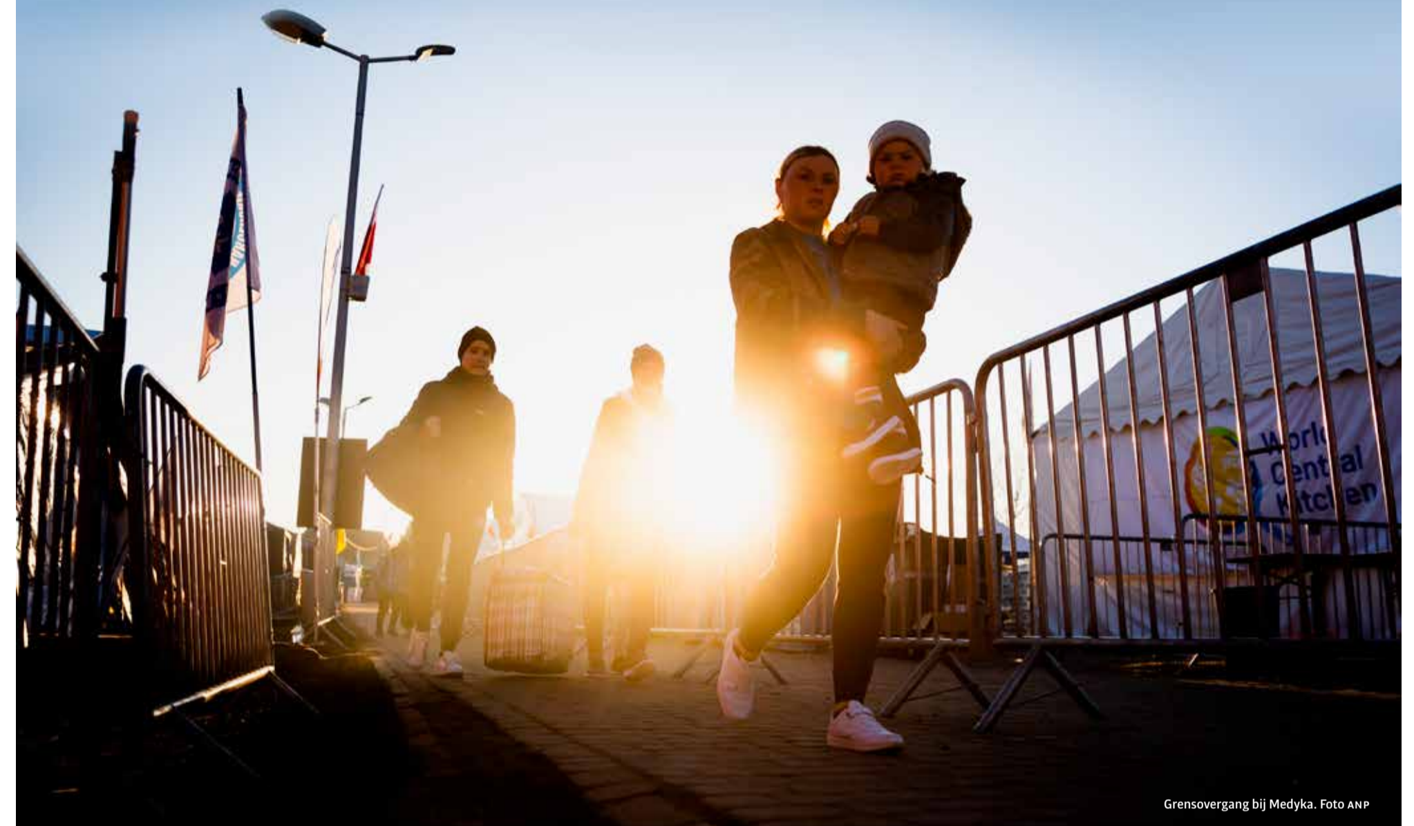
Grensovergang bij Medyka.

Een groep Leidse studenten rijdt regelmatig richting de Oekraïense grens om spullen te droppen en vluchtelingen mee terug te nemen. Mare stapte mee aan boord. 'Veel studenten weten niet wat ze kunnen doen: bij ons kun je gewoon instappen en gaan.'