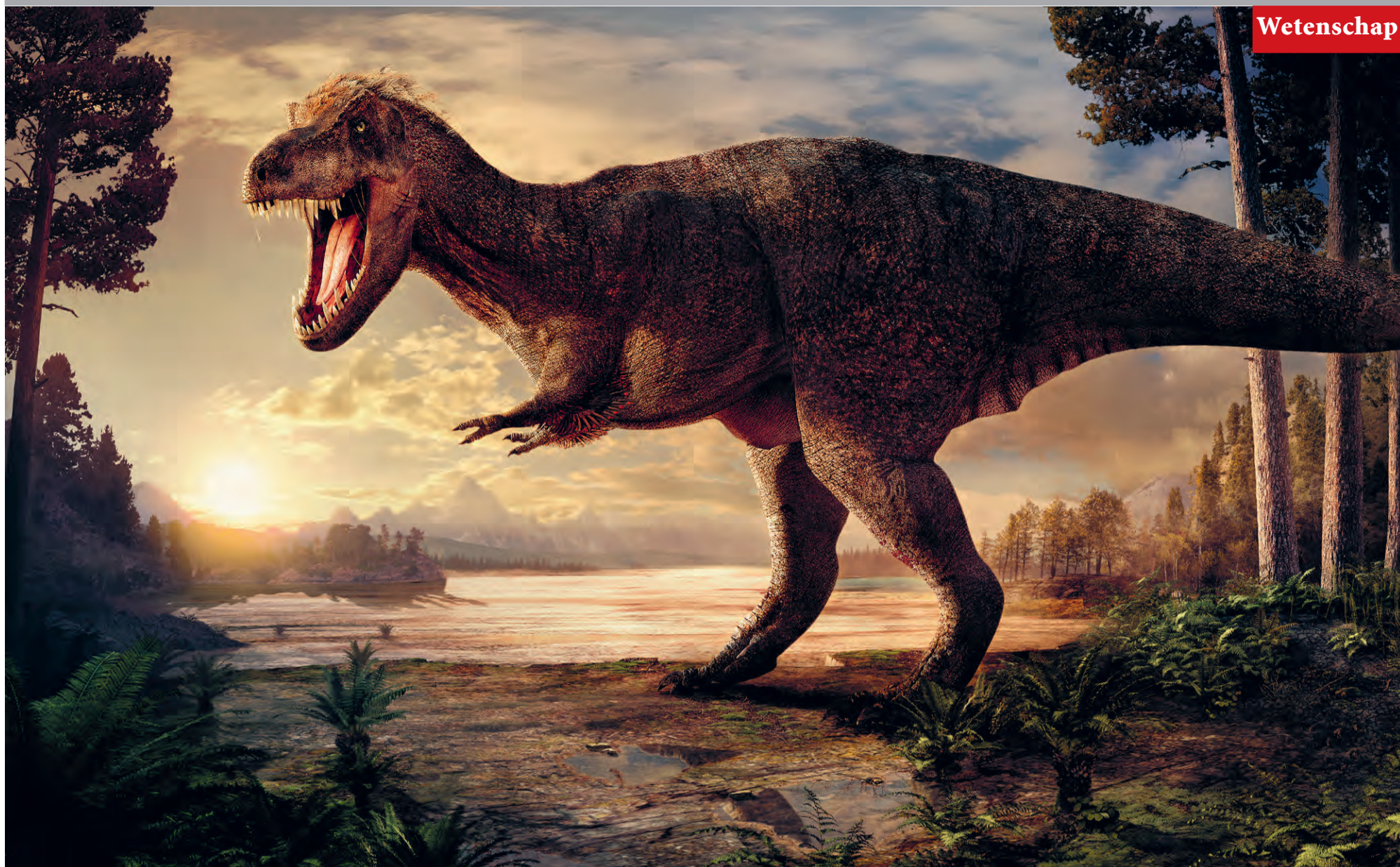
Artist impression van Trix. 'Veren? We weten het niet, en ook niet welke kleur het dier eigenlijk had.' Illustratie Naturalis Biodiversity Center