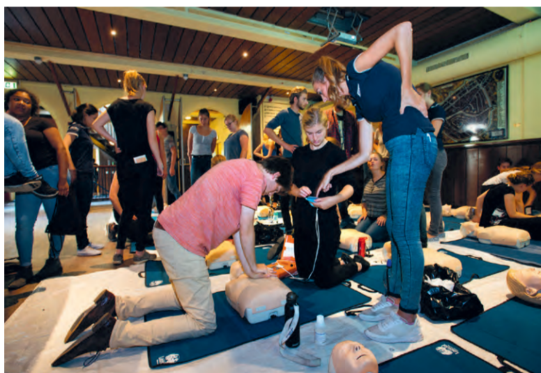
'Neus goed dichtknijpen en nu twee keer beademen!'

'ÉÉN, TWEE, DRIE, VIER, VIJF, ZES!', brult intussen een andere instructeur. Tientallen reanimatiepoppen ondergaan op haar commando borstcompressies. 'ACHTENTWINTIG, NEGENENTWINTIG,