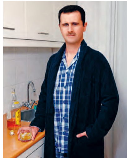
Affiches van de Nacht van de Dictatuur met v.l.n.r. Kim Jong-un, Fidel Castro en Bashar Assad.

Frans Revolutie als een humane en vooral efficiëntere vorm van executie. Het werd in Nederland uiteindelijk samen met de doodstraf afgeschaft in 1870. Toch werd de guillotine in de rest van Europa nog lang gebruikt: de laatste onthoofding vond plaats in 1977, in Frankrijk. En in België mocht wettelijk gezien de guillotine nog gebruikt worden tot 1996, toen de doodstraf daar uit het strafwetboek werd verwijderd.