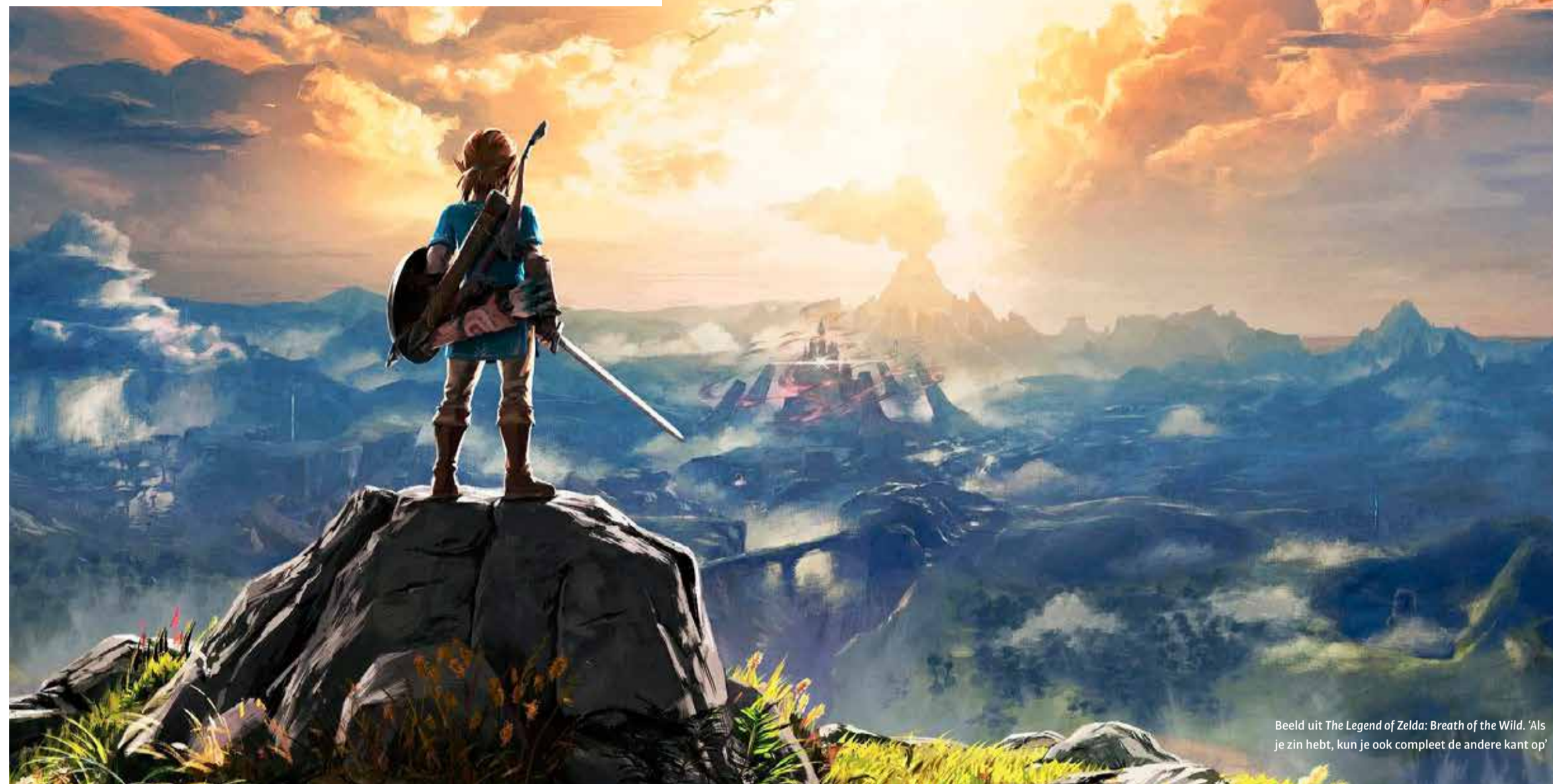
Beeld uit The Legend of Zelda: Breath of the Wild . ‘Als je zin hebt, kun je ook compleet de andere kant op’