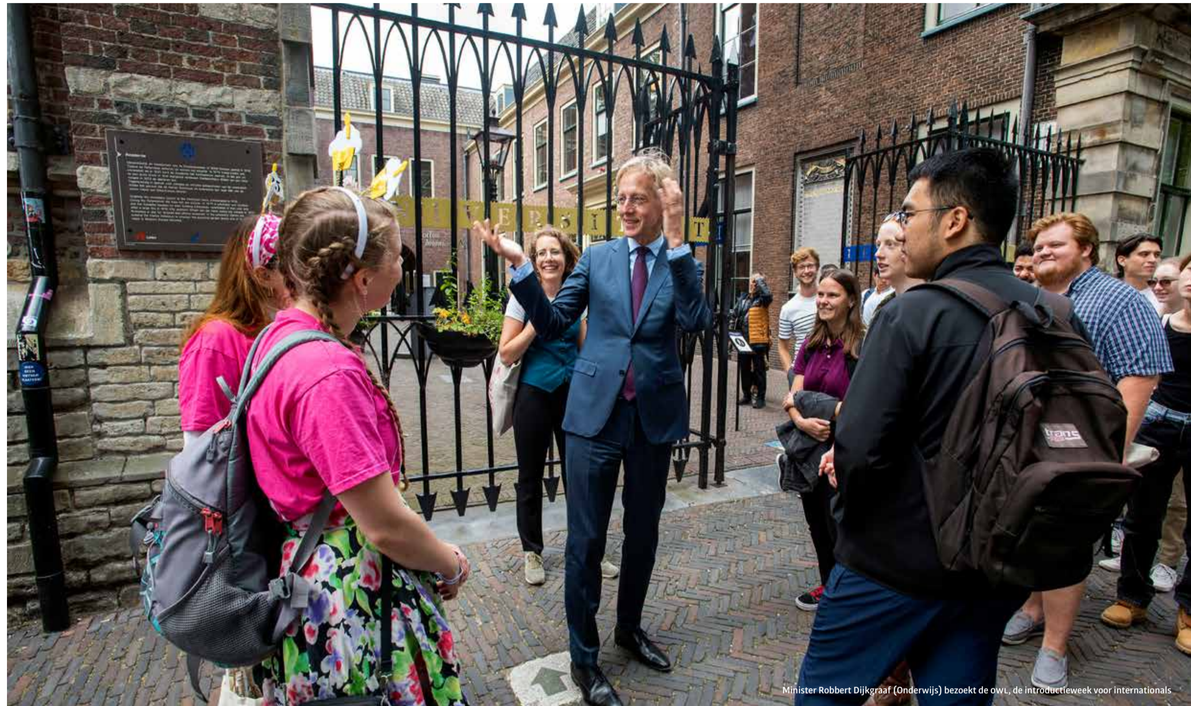
Minister Robbert Dijkgraaf (Onderwijs) bezoekt de owl, de introductieweek voor internationals

Zowel de universiteitsraad als het college van bestuur vinden het onterecht dat internationale studenten door de politiek als probleem worden gezien. 'Leiden blijft uitstralen dat ze van harte welkom zijn.'