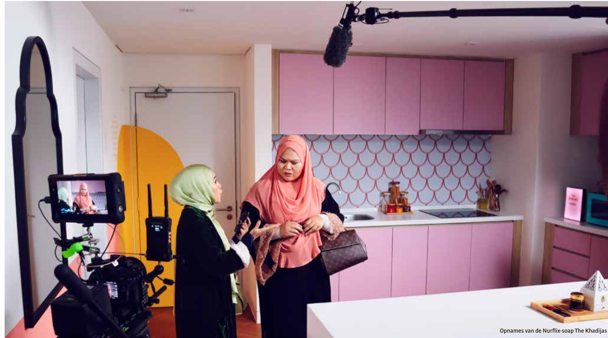
Opnames van de Nurflix-soap The Khadijas

'Nurflix heeft kuise, religieuze soaps. Met halal-reisapps kun je sterren geven hoe sharia-achtig een hotel is'