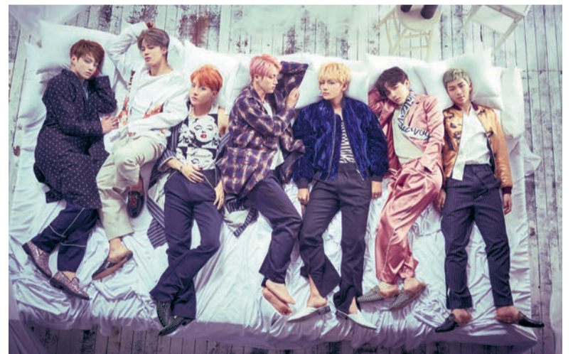
BTS's show in Amsterdam sold out in less than thirty minutes.

Vermunt: "There's a good side to it, too. Because of K-pop, I've learnt lots of things about East-Asian cultures in general. Let's be honest: at secondary school, you learn hardly anything about the East."