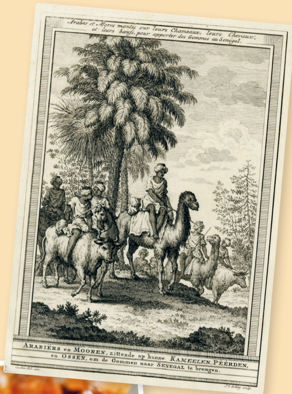
Prent over de gomhandel (1747).