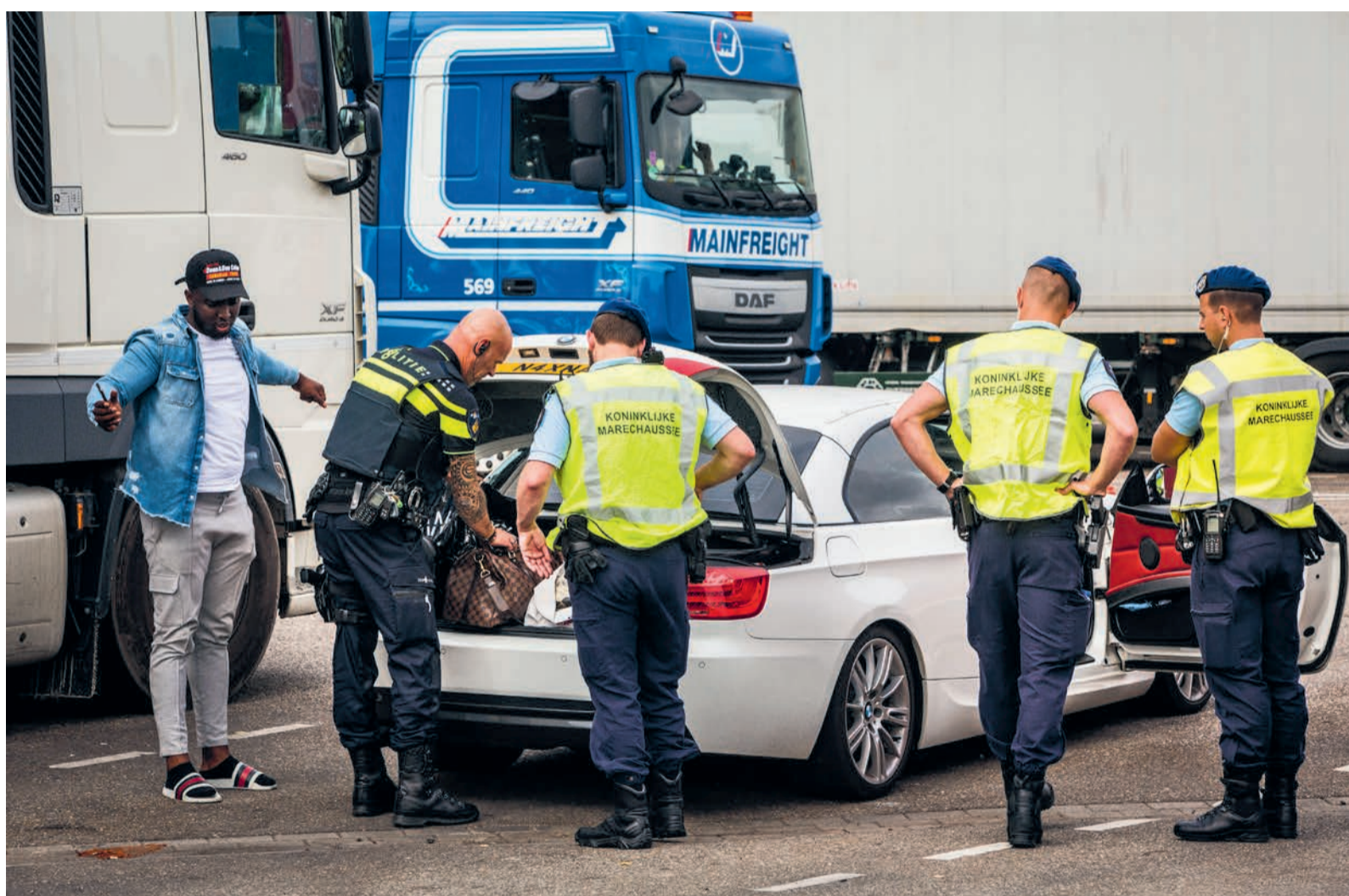
Grenscontrole door de marechaussee op de A16, tussen Breda en België.

Anderhalf jaar lang ging de criminoloog met twee collega-onderzoekers mee. 'Bij de grens houden motorrijders het binnenkomende verkeer in de gaten. Als er iets langskomt waarvan ze denken "interessant", volgt er een controle. Wij wachtten op de parkeerplaats waar die controles plaatsvonden. Daar konden we alles zien en vragen waarom ze die ene auto eruit pikten. We probeerden ook de inzittenden te spreken, als ze daar zin in hadden. De enigen die echt kritisch waren op de controles waren Nederlanders met een migratie-achtergrond. Zij voelden zich