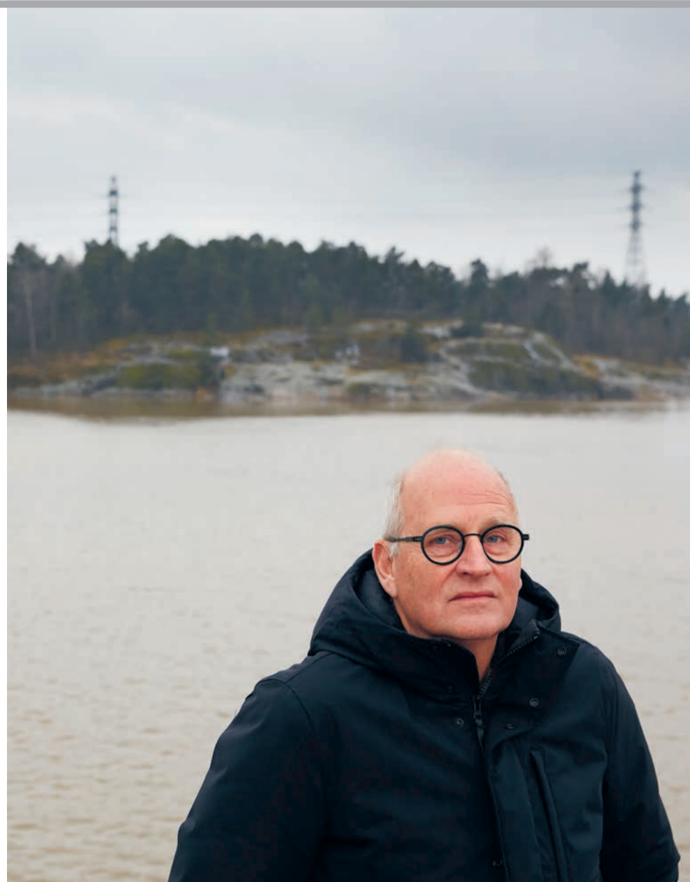
'Er borrelden verhalen op die ik destijds liever voor mezelf hield.'

'Het is niet zo dat ik de hele tijd op zoek was