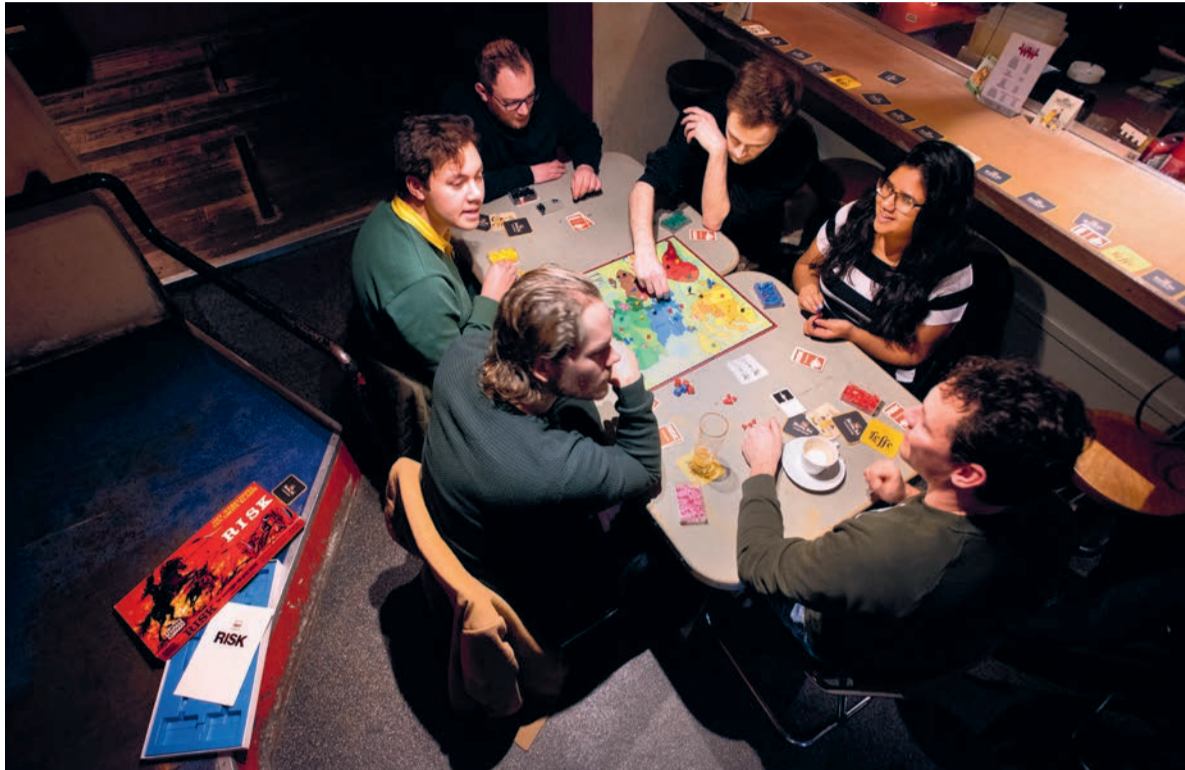
Risk-fanaten in Dranklokaal De WW: 'Bordspellen zijn underrated.'

Elf mannen en één vrouw zitten geconcentreerd achter landkaarten met felgekleurde continenten. Ramondt, die vroeger hele herfstvakanties Riskend doorbracht: 'We gebruiken het oude spel, uit de jaren tachtig, met driehoekjes in plaats van modelpoppetjes.' Tot tevredenheid van deelnemer Koen van Rooden (24, international business): 'Bij de nieuwe heb je geen eigen opdracht, minder leuk.' Toch heeft hij in zijn studentenhuis