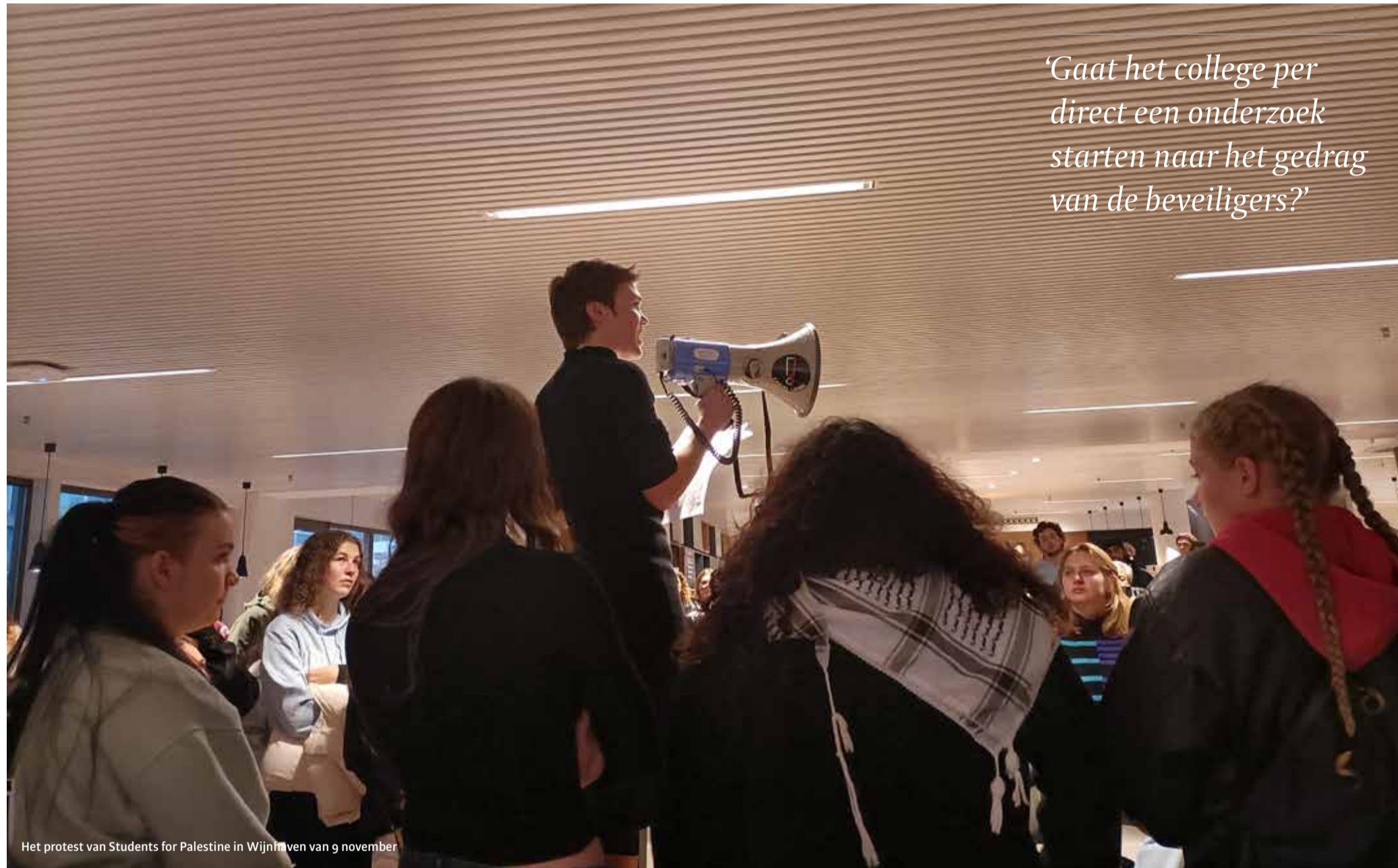
Het protest van Students for Palestine in Wijnhaven van 9 november

‘Gaaf het college per direct een onderzoek starten naar het gedrag van de beveiligers?’