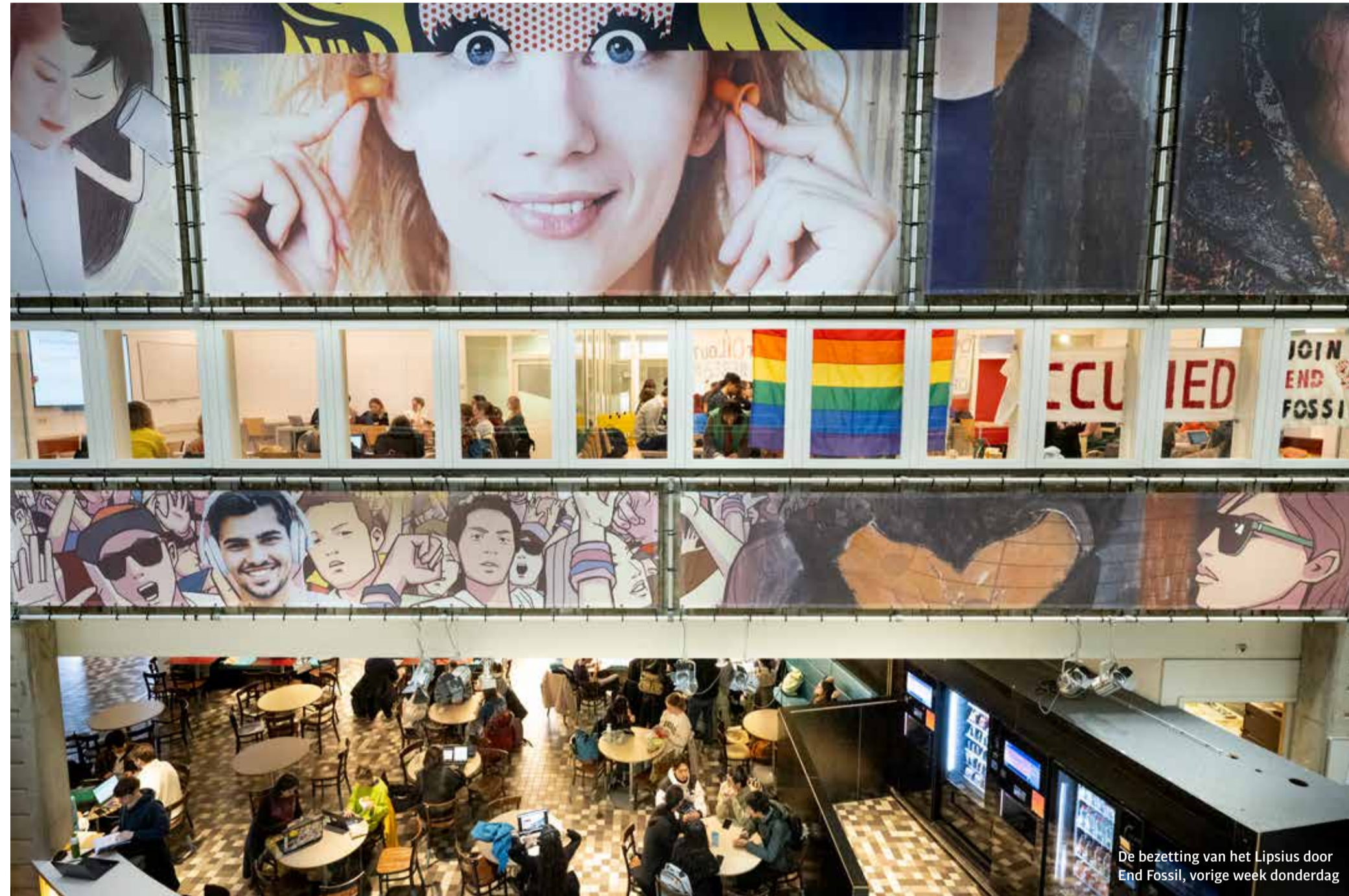
De bezetting van het Lipsius door End Fossil, vorige week donderdag

Veertien jaar wachtten totdat de politiek in actie komt, duurt te lang. Bovendien: voordat de politiek ontwaakt, is een cultuuromslag nodig en die begint bij ons. De vragen die wij onszelf moeten stellen zijn de volgende: Brengt onze wetenschappelijke vrijheid wel of niet de verantwoordelijkheid met zich mee om partijen af te zweren die het menselijk bestaan bedreigen? Willen wij zaken doen met bedrijven die uit economisch eigenbelang decennia lang twijfels hebben gezaaid over op feiten gebaseerde klimaatwetenschap? Willen we samenwerken met een partij die wetenschappelijke desinformatie financierde en die zichzelf nu opnieuw greenwashed met een reclamecampagne (onder het kopje 'Het begint met...') die vooral suggestief is en niet feitelijk. Die reclame werd overigens door burgerbeweging Fossilvrij beantwoord met een krachtig tegengeluid in relatie tot de gedocumenteerde duistere praktijken van Shell in Nigeria. Shell heeft recentelijk goedkeuring gekregen voor de bouw van zowel een waterstofabriek als een installatie voor 'carbon capture and storage' (CCS): het afvangen en ondergronds