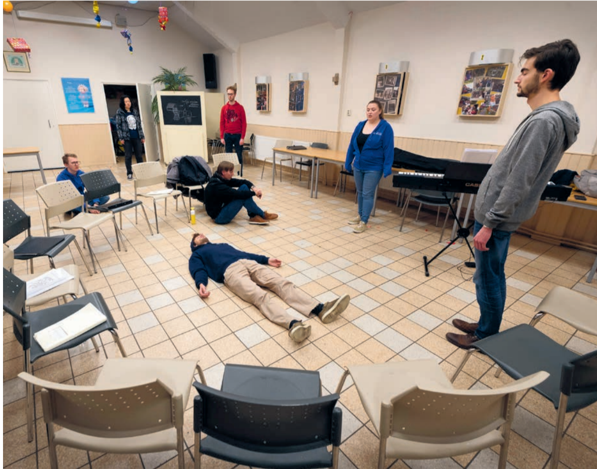
Irrevocable tijdens de repetitie: 'We moeten geen koor voorstellen, maar instrumenten.'

Dorien Conway (22, master jeugdrecht): 'Juist niet! We kunnen een heel gevarieerd programma neerzetten. We zingen bijvoorbeeld een paar stukken die oorspronkelijk voor orkest geschreven zijn. We mogen dan de orkestpartijen zingen.'