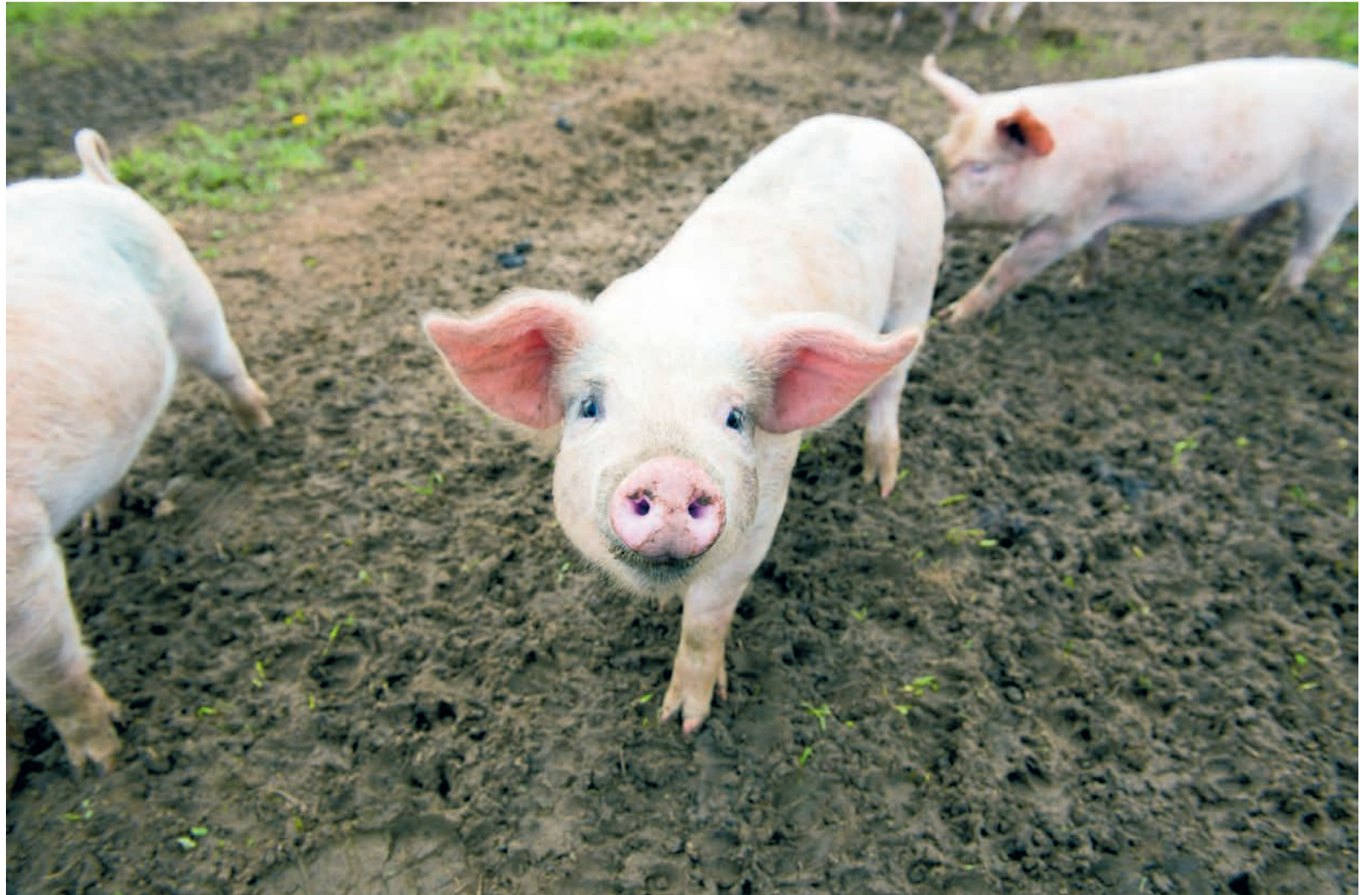
Een gemiddelde vleeseter verorbert in één leven eigenlijk 'tientallen mensen aan morele punten', rekenden Leidse milieukundigen uit.

Aan de andere kant is het niet onmiddellijk duidelijk hoe je precies