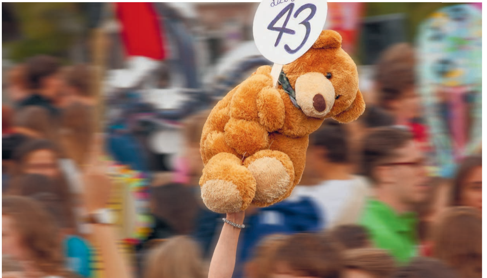
De El Cid-week in 2018. 'Je kunt afvragen: al die mensen die de universiteit binnenhaalt, horen die er echt thuis?'

Terminologie leidt blijkbaar ook nog weleens tot verwarring, aldus het rapport. 'De naam "studentenpsycholoog" lijkt bij veel studenten de associatie op te roepen dat studenten psychologie begeleiding bieden. De naam " psychological counsellor " is al een stuk helderder voor studenten en maakt beter duidelijk dat het om een professionele medewerker gaat.'