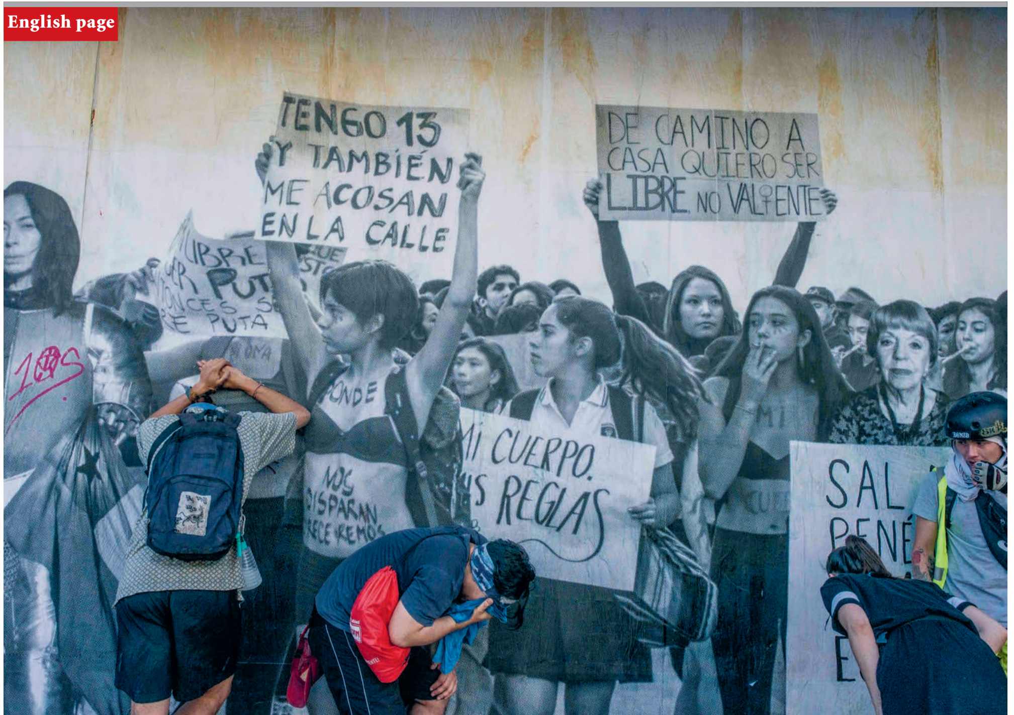
Demonstrators recover from tear gas in front of a mural on display at the Centro Cultural Gabriela Mistral in Santiago, Chile.