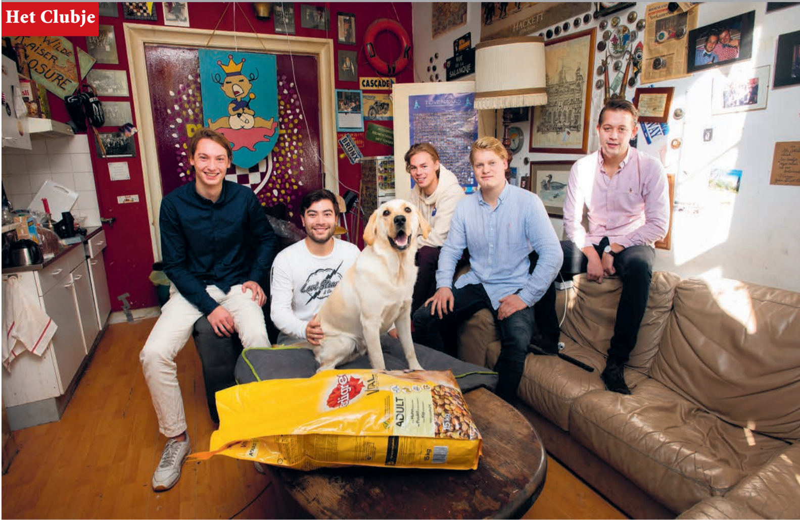
@Lodewijkthelab is half labrador, half golden retriever.