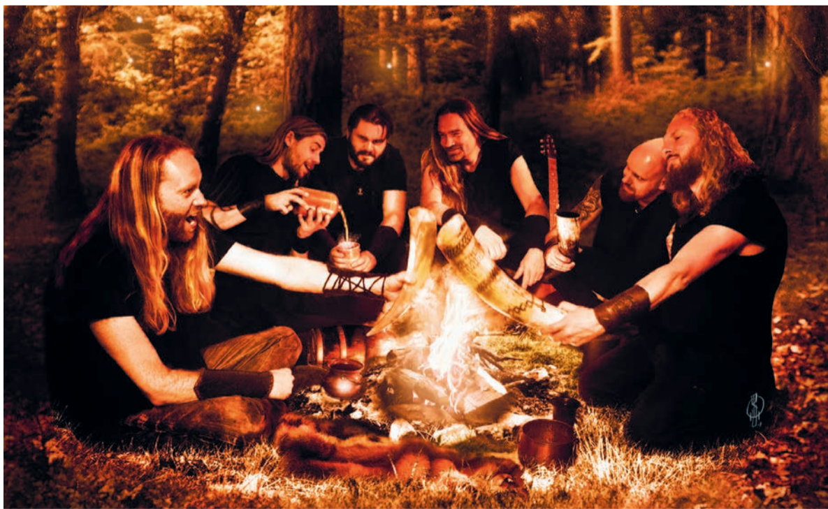
'Zo komen we naar de fans toe, in plaats van iedereen maar af te laten reizen naar Arnhem.'

En omdat metalfans toch al gewend zijn geen ruk te verstaan van de muziek zelfs als die wel in hun moerstaal is, trekt Heidevolk ook internationaal volle zalen. Meer dan negentig procent van hun optredens zijn in het buitenland, waar het publiek fonetisch meezingt met